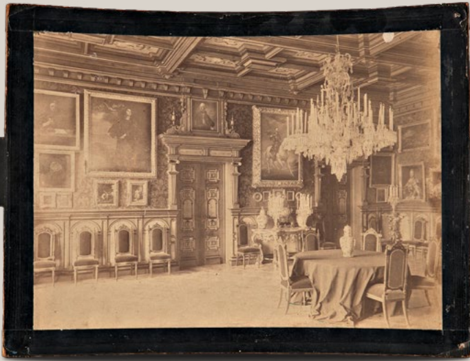
Megaletoscio. Post 1862.